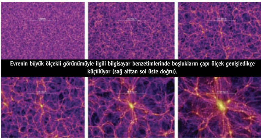
Evrenin büyük ölçekli görünümüyle ilgili bilgisayar benzetimlerinde boşlukların çapı ölçek genişledikçe küçülüyor (sağ alttan sol üste doğru).

Minnesota ekibi, Astrophysical Journal dergisinde yayımladıkları sonuçlara, ABD Ulusal Radyo Astronomisi Gözlemevi’ne bağlı Çok Büyük Dizge (Very Large Array) adlı bir hareketli çanak antenler takımının görüş alanındaki tüm gökyüzünü kapsayan bir araştırmanın verilerini inceleyerek ulaşmış. 1993-1997 yılları arasında gerçekleştirilen çalışmada 1.850 radyo kaynağı kataloglanmış ve 2.326 görüntü elde edilmiş.